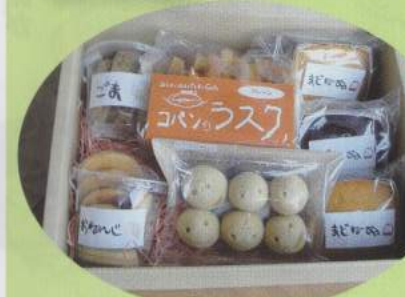
●写真はイメージです

これは「コパン」で働く障がい者の支援にもつながり、さらなる障がい者自立の輪の広がりにもなりますので、これを機会にぜひ「コパンのクッキー詰合せ」を、会社の皆様でお楽しみいただけます。